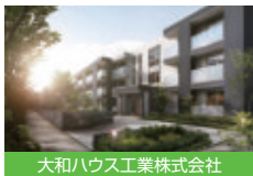
大和ハウス工業株式会社