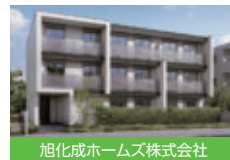
旭化成ホームズ株式会社