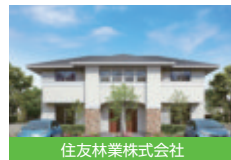
住友林業株式会社