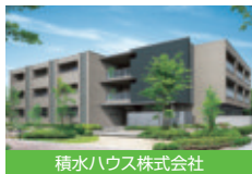
積水ハウス株式会社