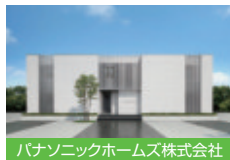
パナソニックホームズ株式会社