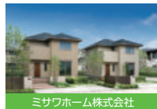
ミサワホーム株式会社