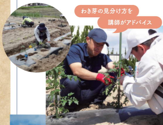
わき芽の見分け方を 講師がアドバイス