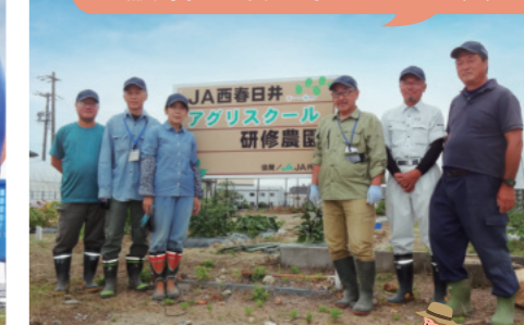
◀令和8年度は第10期生11人が参加。 アグリスクール専用の研修農園で夏野菜の定植について講師の説明に耳を傾ける受講生