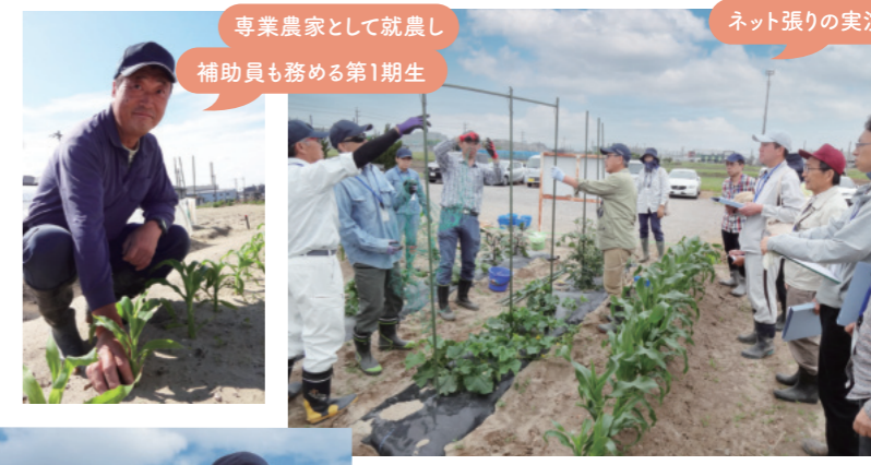
専門農家として就農し 補助員も務める第1期生