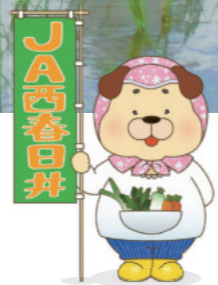
JA西春日井 マスコットキャラクター みのりん