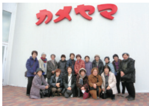
▲カメヤマローソクタウンで記念撮影

最後に立ち寄ったのは、JAみえなかの農産物直売所「きつする黒部」内にあるいちご狩り園。赤く熟した旬のイチゴを心ゆくまで堪能し、親睦の旅を締めくくりました。