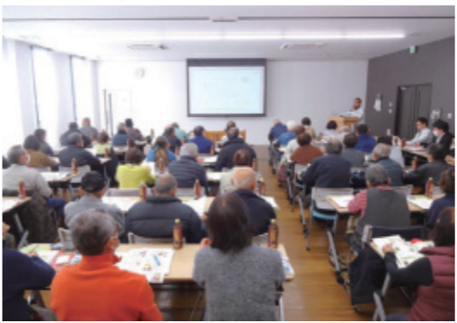
▲種苗メーカーの説明を聞く産直会員

参加者は、個人別カルテと比較しながら有利販売に向けた作付け時期や産直の強みをいかす品目の説明に耳を傾けました。