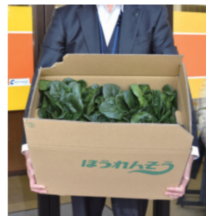
▲管内産のホウレンソウ

調理実習では、おひたしなどを作り試食したそうで、「茹でると色が鮮やかになって驚いた」「新鮮でおいしかった」「ホウレンソウを買う時は、地元産を選ぼうと思う」など感謝や感想を綴った手紙が生徒の皆さんから届きました。