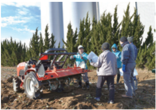
▲トラクターの取扱を確認する参加者