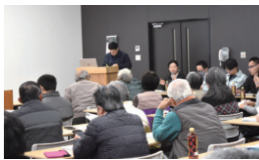
▲講師の説明に聞き入る参加者