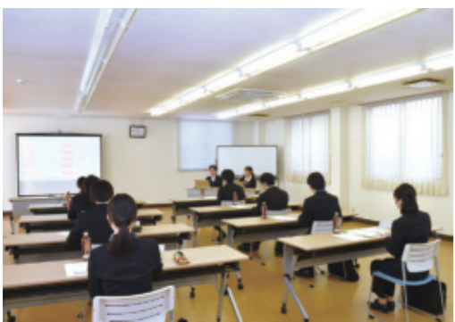
▲先輩職員の話に耳を傾ける学生