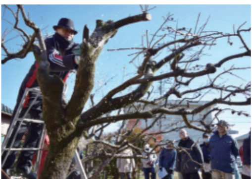
▲せん定の実演を見学する参加者

講習は、カキとミカンの徹底期管理をテーマに行われ、講師が実演を交えながら整枝やせん定方法を解説。「カキは作業効率や安全性の面から低木栽培を推奨します。全体のバランスを見ながら、将来に向けて思い切つたせん定をすることも選択の一つ」などアドバイスし、参加者は身を乗り出して聞き入っていました。